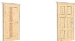
0.84×1.885 м. 0.84×1.885 м.